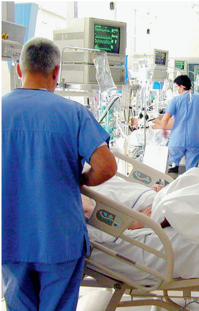
Infermieri impegnati al letto dei pazienti in un reparto di Rianimazione